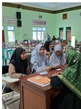
Gambar 2. Kegiatan wawancara siswa sebagai bagian dari tahap Concrete Experience dalam model Experiential Learning .

Pada tahap Concrete Experience (CE), kegiatan wawancara dan observasi langsung mendorong siswa untuk mengumpulkan data faktual dan melatih kemampuan bertanya yang relevan. Temuan ini sejalan dengan Shi & co-authors, (2025) yang menunjukkan bahwa keterlibatan langsung memperkuat akurasi informasi dan kesadaran pragmatik. Proses ini juga serupa dengan hasil Ma’arif et al., (2022) yang menegaskan peran pengalaman nyata dalam membentuk refleksi dan tanggung jawab personal terhadap kebenaran data.