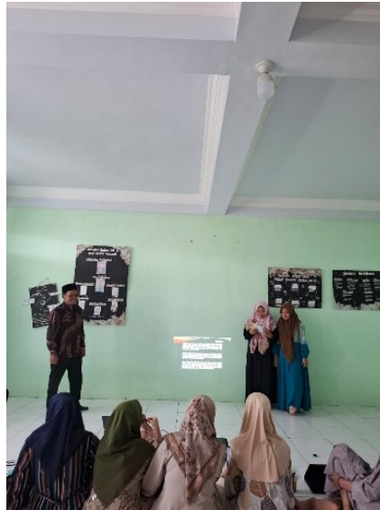
Gambar 3. Kegiatan membacakan hasil wawancara siswa yang telah dikonversi menjadi teks berita.

Selain itu, hasil penelitian ini sejalan dengan gagasan (Dewey, 1938) tentang pentingnya pengalaman dalam pendidikan progresif. Dewey menekankan bahwa pembelajaran harus berakar pada pengalaman nyata agar pengetahuan tidak bersifat abstrak semata. Dalam konteks penelitian ini, siswa tidak hanya mempelajari unsur berita secara teoretis, tetapi juga mengalami langsung proses jurnalistik seperti observasi, wawancara, dan penyusunan informasi faktual. Dengan demikian, pembelajaran menjadi bermakna karena terkait langsung dengan realitas yang mereka alami.