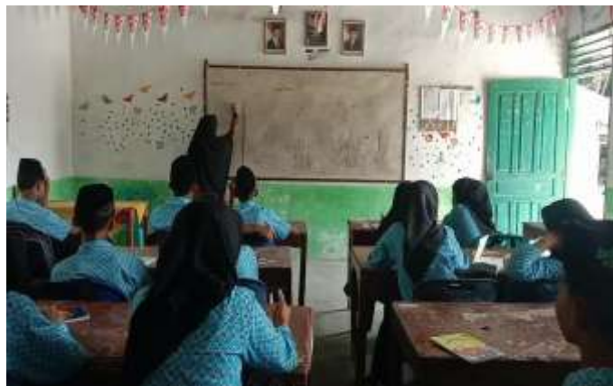
Gambar 3. Pemateri menyampaikan materi terkait TOEFL

Kegiatan menyampaikan materi TOEFL dilakukan secara sistematis dan jelas kepada siswa dengan menggunakan metode presentasi yang menarik. Peneliti menyampaikan pengertian, tujuan, dan jenis-jenis TOEFL secara singkat dan menarik dengan metode menulis di papan tulis. Selanjutnya peneliti memberikan tips dan strategi kepada siswa untuk menjawab soal TOEFL dengan efektif.