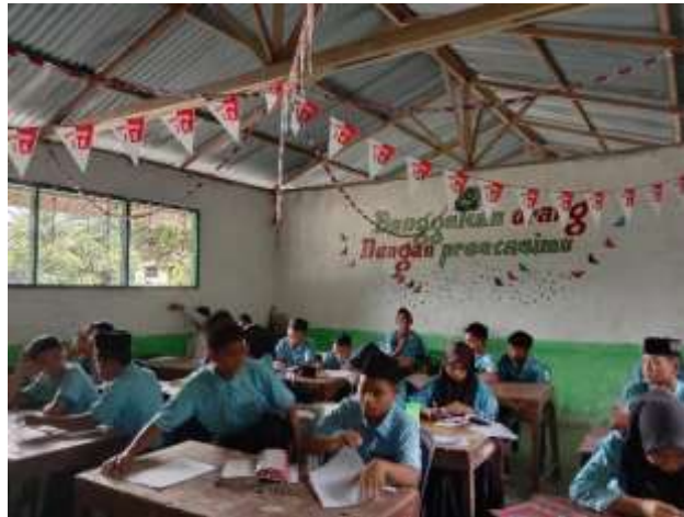
Gambar 4. Siswa mengerjakan soal-soal materi terkait TOEFL