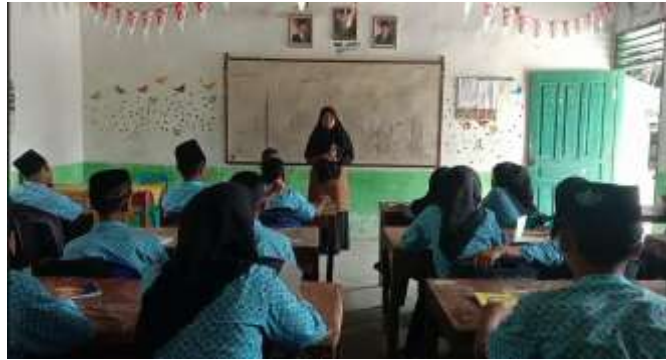
Gambar 2. Pemateri membuka kegiatan dengan pengenalan TOEFL

Tujuan dari perkenalan TOEFL yaitu agar beri gambaran kepada siswa bahwa TOEFL sangat di butuhkan ketika mereka memasuki dunia kerja yang mengharuskan setiap karyawannya harus bisa berbahasa Inggris, namun tidak semua dunia kerja mengharuskan bisa berbahasa Inggris. Namun dengan adanya perkenalan TOEFL bisa membuat mereka mengetahui apa itu TOEFL dan cara mengaplikasikannya ke kehidupan mereka kelak. Selanjutnya peneliti memberikan tips dan strategi kepada siswa untuk menjawab soal TOEFL dengan efektif.