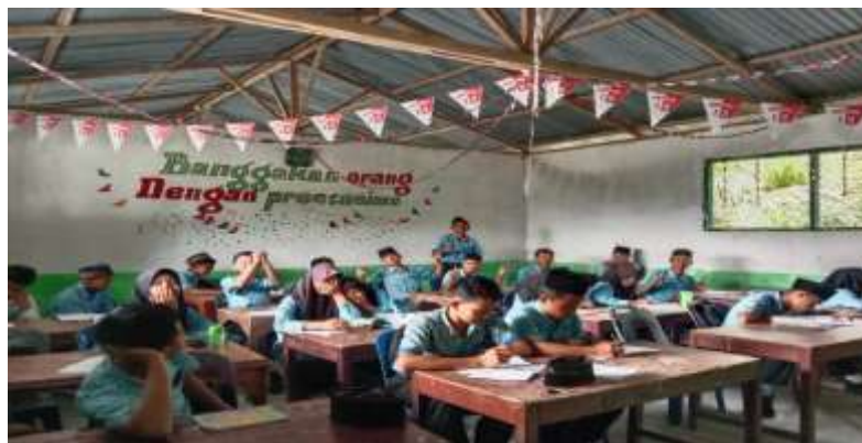
Gambar 5. Sesi foto di tempat sekelas di kelas IX

Setelah selesai mengerjakan soal-soal tes terkait TOEFL, peneliti meminta mereka untuk berfoto di tempat duduk mereka masing-masing agar menciptakan kenang-kenangan mereka dan sambil mengerjakan TOEFL.