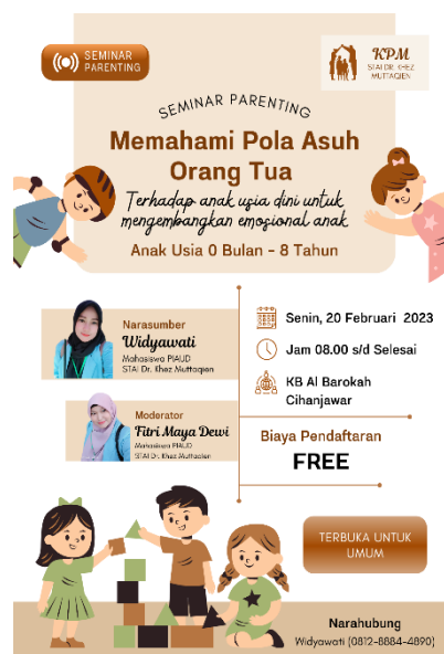
Gambar 1. Pamflet Seminar Parenting

Peneliti meminta izin kepada kepala sekolah untuk mengadakan sosialisasi seminar atau seminar mengenai parenting di sekolah tanpa pikir panjang kepala sekolah menyetujui saran yang di sampaikan oleh peneliti. Kemudian Peneliti membuat perencanaan dengan kepala sekolah untuk mengadakan sosialisasi seminar pada Hari Senin, 20 Februari 2023 di sekolah dengan tema “Memahami Pola Asuh Orang Tua Terhadap Anak Usia Dini Untuk Mengembangkan Emosional Anak”.